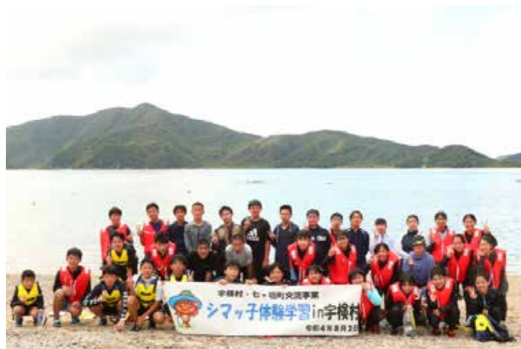
【シマっ子体験学習時の集合写真（タエン浜海水浴場）】

令和4年8月3日 して2014年から本事業（水）、3年ぶりとなる宮城七ヶ宿町との交流事業が開催されました。東北福祉大学の縁を契機とし交流を深めています。