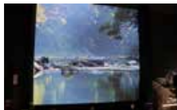
【奄美の絶景を映し出す巨大スクリーン】

環境省と林野庁による世界自然遺産候補地に関する検討会で、世界遺産の登録基準を満たす可能性が高い地域として選定されてから世界自然遺産登録に至るまで19年。島全体が一丸となり世界自然遺産登録に向けて様々な取り組みを続け、着実に行動することができたことが世界自然遺産登録に繋がりました。