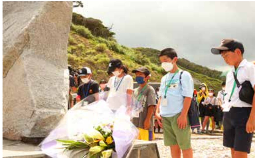
【慰霊碑に献花後、参加者全員で黙祷が捧げられた（船越海岸）】

ワークショップを行い交流を深めた後、犠牲者のために建立された慰霊碑を訪れ、戦争の悲惨さと平和の尊さについて学習しました。