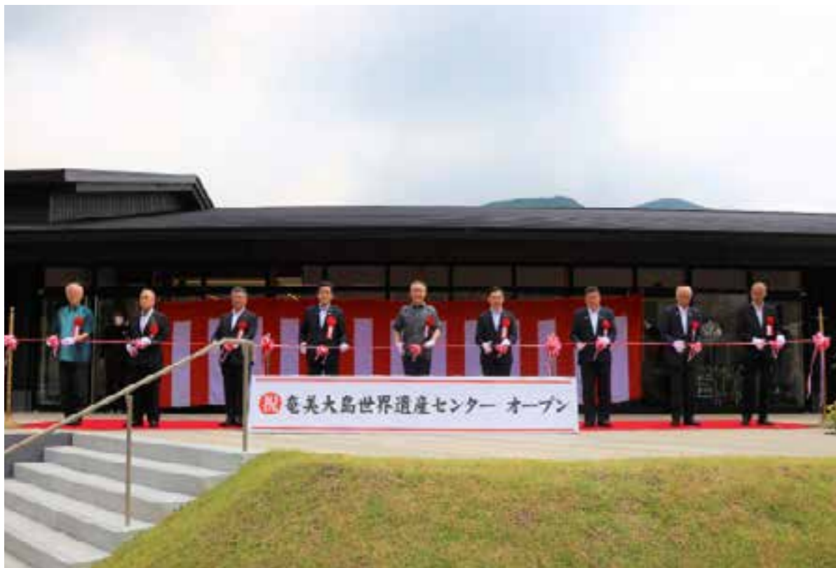
【奄美大島5市町村長等によるテープカット（奄美大島世界遺産センター）】

環境省と林野庁による世界自然遺産候補地に関する検討会で、世界遺産の登録基準を満たす可能性が高い地域として選定されてから世界自然遺産登録に至るまで19年。島全体が一丸となり世界自然遺産登録に向けて様々な取り組みを続け、着実に行動することができたことが世界自然遺産登録に繋がりました。