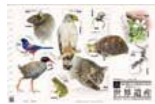
特別記念切手デザイン