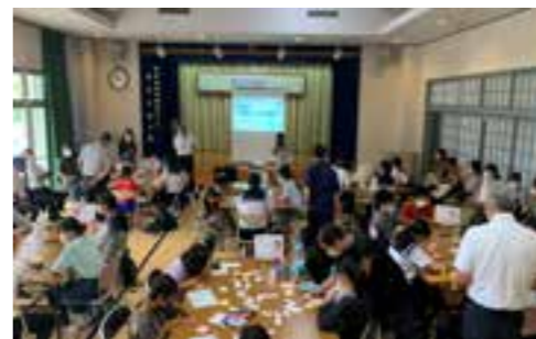
【アイスブレイクで緊張もほぐれ積極的にグループワークに臨む参加者】

ワークショップを行い交流を深めた後、犠牲者のために建立された慰霊碑を訪れ、戦争の悲惨さと平和の尊さについて学習しました。