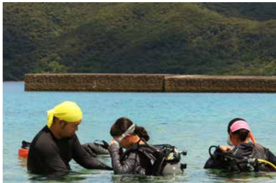
【初めてのスキューバダイビング】

自然環境や生活文化の異なる地域で様々な体験を通して広い視野をもつとともに自然と共生していくこうとする気持ちを育てることを目的として実施しています。しかし、過去2年間は新型コロナウイルス感染症の影響を受け開催を断念。特産品を贈り合う等の代替行事で事業を継続してきましたが、念願叶って現地開催が実現しました。今年度は、過去2年間現地での交流ができていなかった現中学1・2年生（宇校村16名、七ヶ宿町20名）が対象でした。生徒たちはスキューバダイビングやカヤック、SUP、海水浴等を楽しみながら交流を深めました。