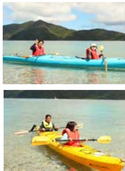
【相乗りカヤックで一気に距離が縮まりました！】