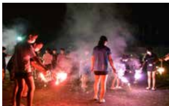
【交流最後はみんなで花火】