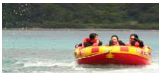
【スリル満点ツッパ体験】

「こんなに色とりどりで綺麗な魚やサンゴが見ることができて驚き！」初めての体験だったけどこの感動をみんなで共有できたことが嬉しかったよ！