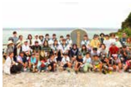
【現地視察時の集合写真】

1944年8月22日。学童・一般疎開者に乗せた疎開船「対馬丸」は那覇から長崎へ向かう途中、アメリカ海軍潜水艦からの魚雷攻撃を受け沈没。宇検村や大和村等に多くの犠牲者や漂流者が流れ着きました。当時の悲惨な事件を語り継ぐため、村は2017年に慰霊碑を建立。翌年2018年から本事業が始まり、近隣市町村合同で実施したのは今回が初めての試みでした。