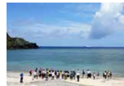
【目を閉じて当時の悲惨な状況を考える】

参加者の感想 ○犠牲者が多く流れ着いた奄美大島の海を飛行機から眺めると海は広大だった。そこで1週間もの長い間、互いを励まし合い流れ着いた漂流者を尊敬します。 ○「人間は月日が経てば何かしら忘れてしまいが、戦争という過ちだけは繰り返してはいけない。後世に伝えるべきだ。」事前研修で聞いた対馬丸事件生存者の話が残らない。