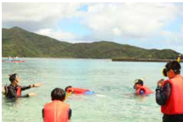
【たくさんの生き物に出会えた海水浴】