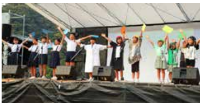
【自然環境に関する舞台発表を行った阿室小学校の児童】

同施設の展示室では、15分ごとに音響や照明が切り替わる演出で昼と夜の雰囲気や短時間で体験することができるとともに奄美の希少な動植物の剥製や巨大スクリーンに映し出される大迫力の絶景を体感することができます。