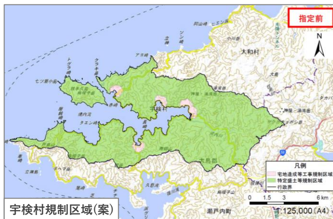
宇検村規制区域(案)

市街地や集落などから離れているものの、地形等の条件から、盛土が行われれば人家等に危害を及ぼしうるエリア