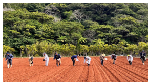
▲ソバ春植えの様子 (令和6年2月・芦検地区)