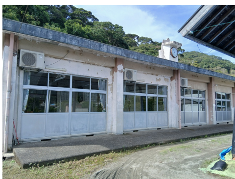
▲建替を予定している須古公民館（令和9年度着工予定）

(総務課) 現在、見直しをしているところ。10年計画で進めているが、腐食や劣化の度合いによつては、5年で見直さないといけない場合もあるため、慎重に計画を策定しているところ。