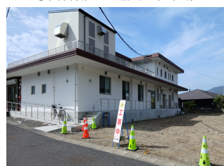
▲②河川側出口へ出る一方通行