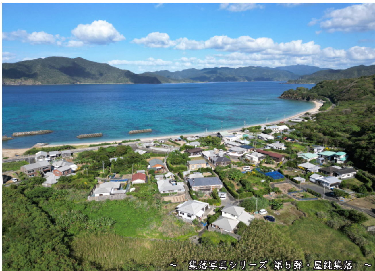
～ 集落写真シリーズ 第5弾・屋鈍集落 ～