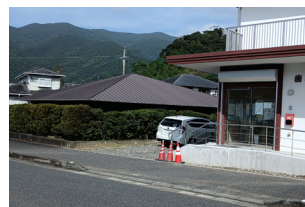
▲①歯科側から進入し駐車場へ