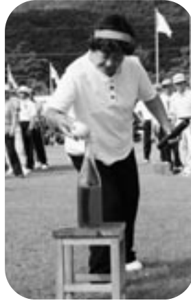
慎重に、慎重に水入れ