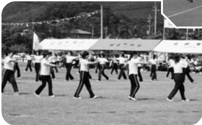
大会に花を添える婦人団 のマスゲーム