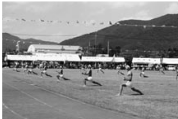
三人の息が試される二人三脚（写真 上）と、中学生のエッサッサッサ