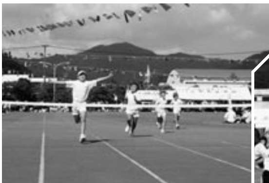
小学生の100メートル走、手を広げてゴール