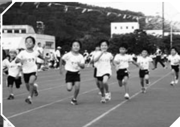
保育所年長組（きりん組さん）のかけっこ