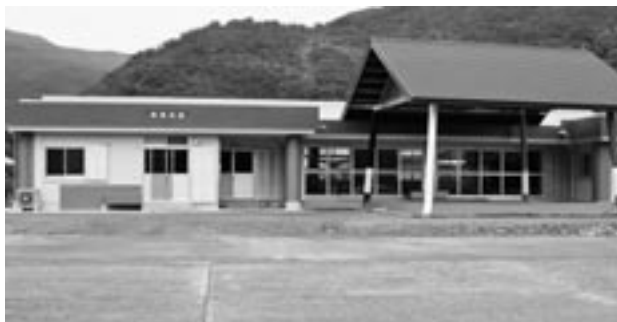
完成した湯湾公民館