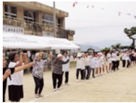
校区全員で盛り上げる運動会

行事を終えるたびに、心の中にホツと温かい場所ができる。久志小中学校がこんなに穏やかで、温かくて、毎日笑いが絶えないのは、ここに暮らす人に反映しているのでしょうか。 人と人とのつながりだとか、人の温かさとかに限らず、素直に、ここに暮らす人たちが生み出すこの雰囲気が好き。大きな輪の中で、わたしも久志住民のひとりであり、宇検村民であることを自覚せずにはいられません。