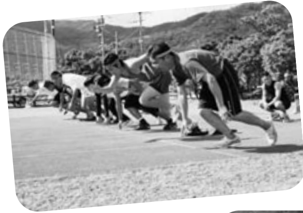
スタートダッシュが肝心！ 男子30代 100メートル走