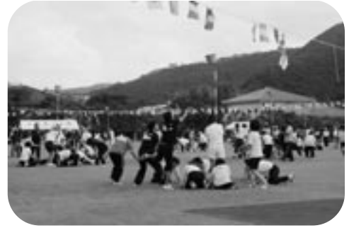
今年は屋鈍が圧勝でした、なり入れ