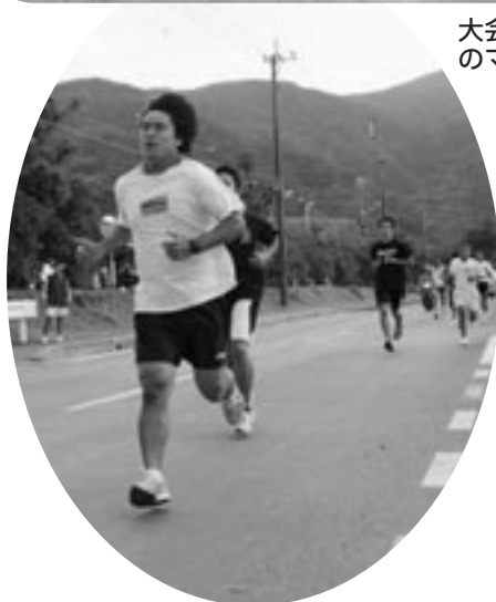
田検の轟橋を折り返す五千メートル 走（写真左）