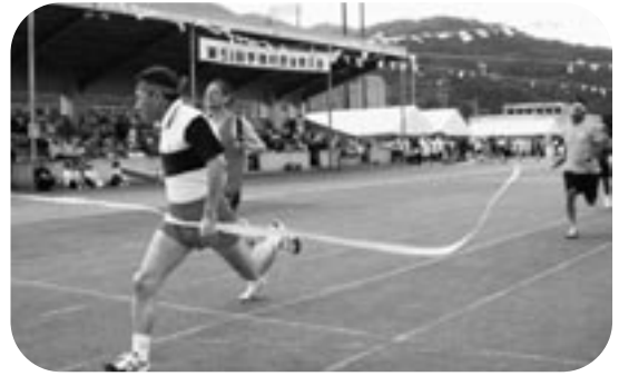
湯湾と須古が最後まで競り合った、年代別リレー