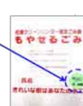
【処理手数料納入シール】