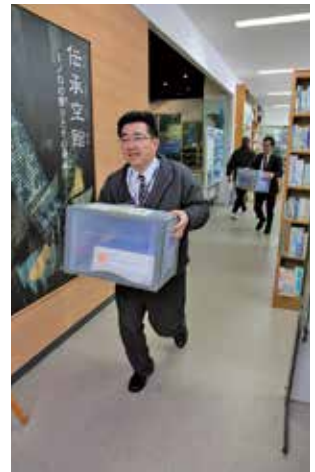
消火活動と重要書類の搬出を行う訓練参加者