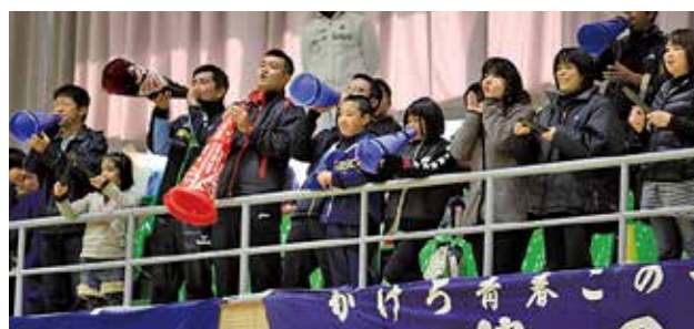
選手へ声援を送る保護者ら応援団