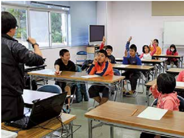
奄美の自然を深く学んだ「奄美大島の魅力体験会」