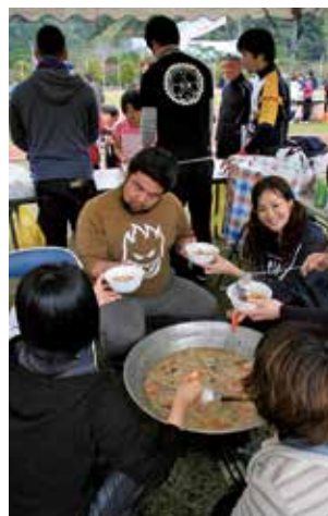
豚汁を作る連青団員と特産品販売に並ぶ参加者