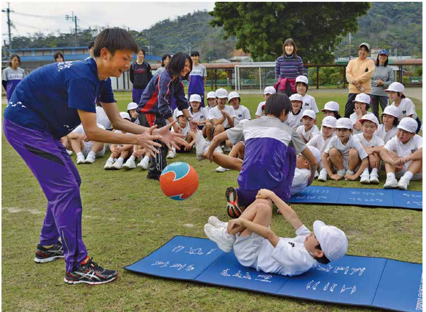
宇検村で合宿を行った東北福祉大学陸上部と田検小児童の交流会 (2月25日(火) / 田検小学校校庭) 【※詳細は次号へ掲載します。】