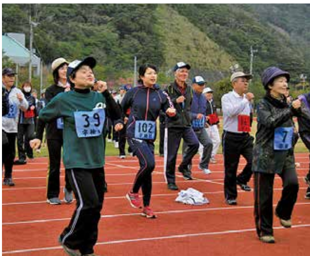
会場では音楽に合わせて行う健康体操も実施

奄美の自然のすばらしさを学ぼうと「奄美大島の魅力体験会」が、2月8日（土）に生涯学習センター元気の出る館で行われました。会には村内の児童と保護者19名が参加。自然の各分野（海・山・川）に詳しい3名の先生方が講師を務め、マングローブやアマミノクロウサギ、水の生き物などについて話をしてくれました。参加者は「知らない事がたくさんあった。自然豊かな奄美を大切にしたい。」などと話してくれました。