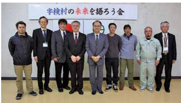
語ろう会の後に出席者全員で記念撮影

元田村長は「行政として世界自然遺産登録を見据えた施策を進める体制を整える。民間企業や団体、村民の協力を頂き、村全体で取り組みたい。」との考えを述べました。