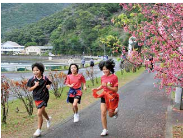
ヒカンザクラの横を元気に駆け抜ける子供たち

2月9日（日）、村陸上競技場を会場に「健康づくり完走歩大会」が開催されました。当日は曇り空となる天気の中、約300名の方が参加してくれました。大会は3km・5km・10kmのコースがあり、参加者はコース沿いにあるヒカンザクラの花見を楽しみながら、それぞれのペースで汗を流しました。また、会場では「生活研究グループ」と「うけん市場」による食品の販売や村連合青年団が作った豚汁が無料で振る舞われ、とても喜ばれていました。