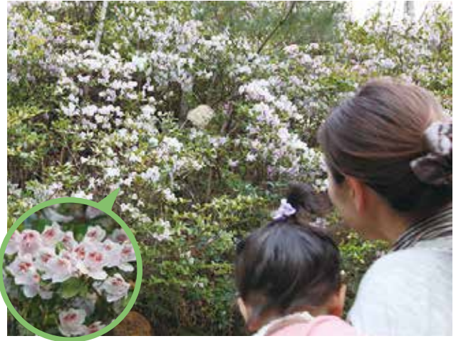
宇検集落入り口の山に群生するサクラツツジ

1月末から2月上旬にかけて村内でもヒカンザクラが見事に花を咲かせました。多くのヒカンザクラがある総合運動公園の周辺では、村外からも見物客が訪れ、花見を楽しんでいました。また、宇検集落入り口の山には、斜面に沿ってサクラツツジの群生があり、同時期に満開となりました。3月末には、湯湾岳公園近くのソメイヨシノと峰田山公園にある数種類のツツジが見ごろとなる予定です。これからの花見も、お楽しみください！