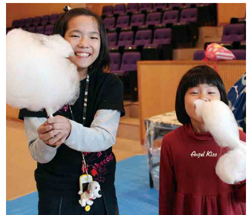
仲良く2人で綿あめを