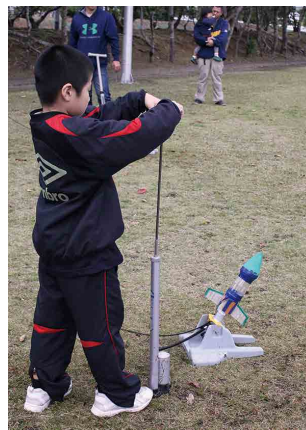
ペットボトルロケット