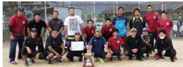
▲見事優勝に輝いた湯湾青壮年団の皆さん（下）