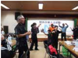
▲約20年ぶりの開催となった関西田検人会の様子