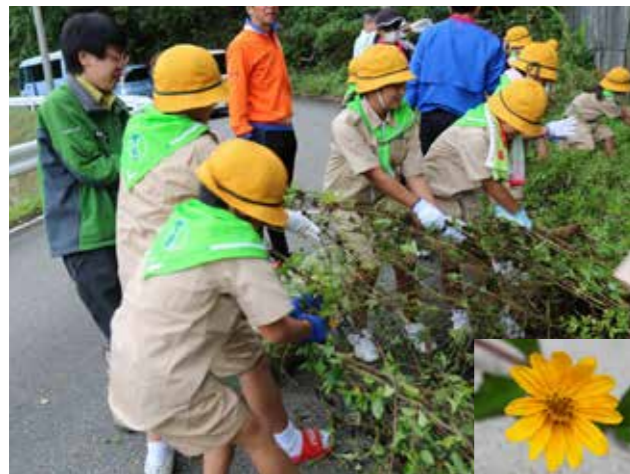
▲みんなで協力してアメリカハマグルマを駆除