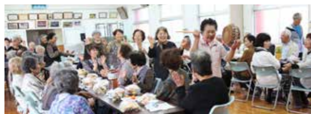
▲島唄や八月踊りをして交流する様子