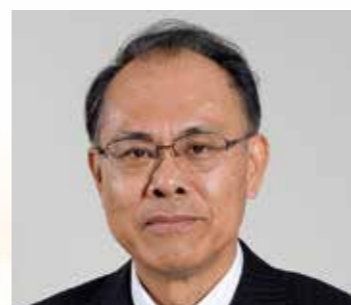
宇検村長 元田信有