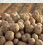
農林水産物の流通加工