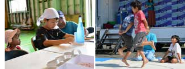
▲多くの来場者で賑わった会場の様子