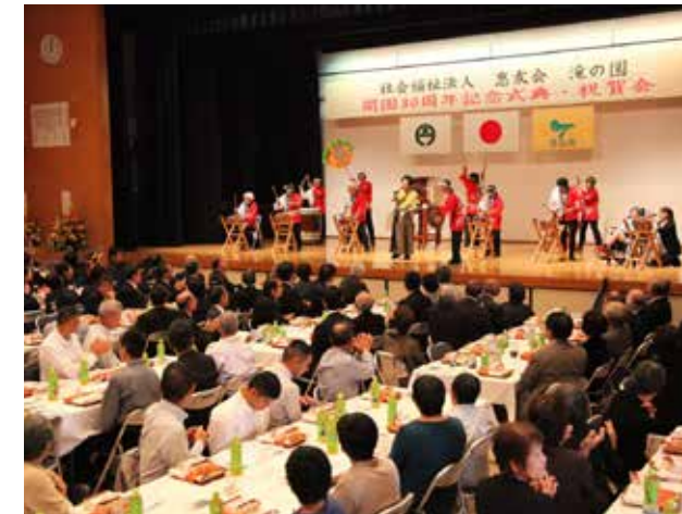
▲利用者や職員による多彩な余興で花を添えた

平成30年12月25日から2泊3日の日程で村内の小学生12名が宮城県七ヶ宿町を訪問しました。友好都市協定を締結している宮城県七ヶ宿町との児童交流事業は今回で5回目。子どもたちは、七ヶ宿町スキー場でのスキー体験やそば打ち体験を行ったほか、東日本大震災の被災地を訪問。仙台市内では、ケヤキ並木に数十万に上る数のLEDが取り付けられたイルミネーションイベント「光のページェント」を見学しました。