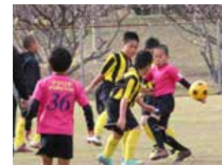
▲子どもたちのボールを追いかける一生懸命な姿！