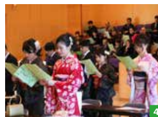
1 全員で記念撮影 2 近況報告 や将来の夢を楽しく話す 新成人の皆さん 3 スーツをき て背筋が伸びる男性陣 4 来場 者全員で村民歌を歌う様子