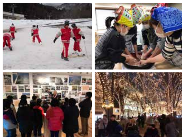
▲スキーやそば打ちなど貴重な体験ができました

平成30年12月23日（日）結の館前駐車場にて、第7回うけん市場祭りが開催されました。会場には、村内で採れた新鮮な野菜や果物、海産物などのほか、手作りのお菓子、惣菜、コーヒーやパンなど様々な商品が並び、大賑わい。今回は和牛日本一に輝いた鹿児島黒牛をPRするためサイコロステーキを振る舞う試食ブースを設置。開始時間と同時に長蛇の列ができ、来場者らはA5ランクの鹿児島黒牛を美味しそうに味わっていました。