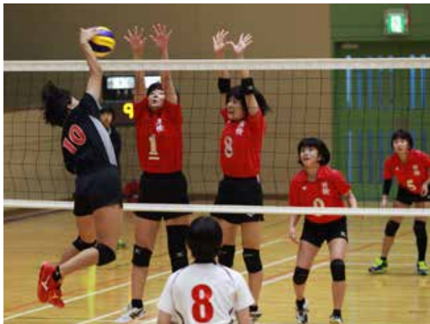
▲強烈なスパイクに必死に食いつく田検中学校の選手

奄美ならではの自然や文化に触れあうことのできるコースを鹿児島県が地域の住民と一緒に選定する世界自然遺産奄美トレイル。宇検村の3コースの開通式が、平成31年2月3日（日）、第21回宇検村健康づくり完走歩大会と併せて開催されました。宇検村では「倉木崎・峰田山・待ち網漁」11.9 km、「うけん市場・湯湾集落・湯湾岳」5.9 km、「佐念のガジュマル・タエン浜・屋鈍の三月石」10 kmの3コースを選定しています。