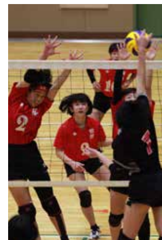
▲気迫あふれるプレーで会場を沸かせる！