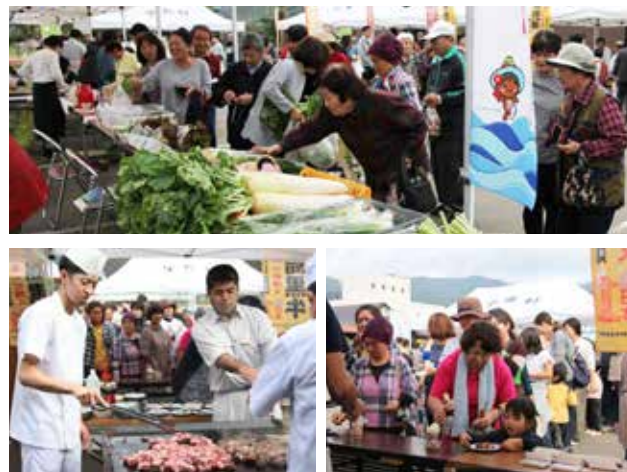
▲最高ランクのサイコロステーキが振る舞われました

第11回宇検村お魚祭りが平成30年12月16日（日）、漁協施設前にて開催されました。11時の販売開始前からたくさんの来場者が訪れ、列をつくりました。スタートと同時にエビ汁、イカ墨汁販売には長蛇の列。また、地元海産物販売コーナーでも来場者らは正月の品を競うように買い求めていました。その他、ハリセンボンとキハダマグロの解体ショーも行われ、来場者らの目を楽しませていました。