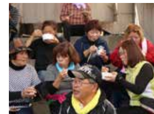
▲ゴール後には豚汁などが振る舞われました