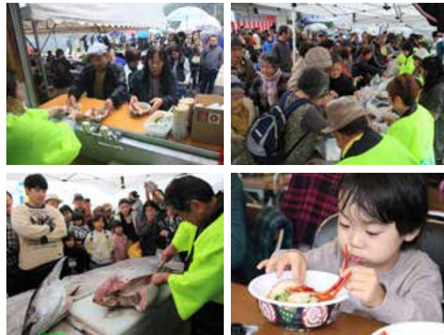
▲人気のエビ汁に長蛇の列。大盛況となった会場の様子