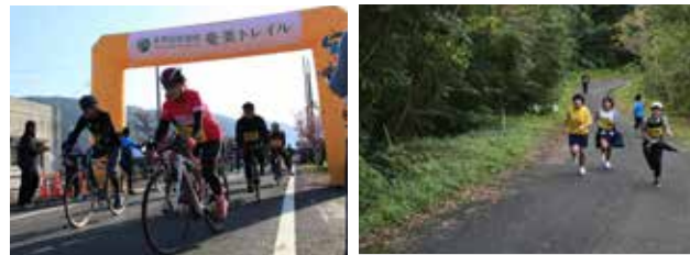
▲開通式（上）号砲とともにスタートする様子（左下）