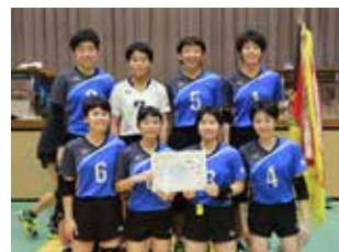
▲優勝した朝日中学校の選手のみなさん