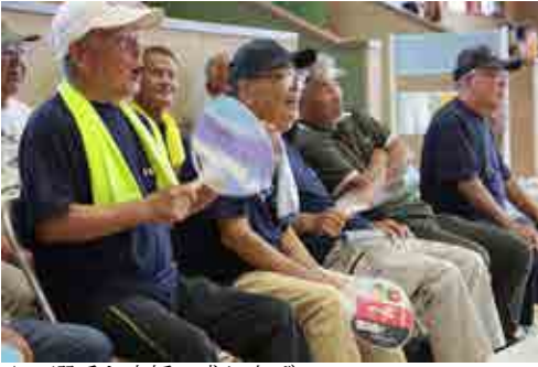
▲選手を応援で盛り上げる

宇検村総合体育館にて、宇検村高齢者スポーツ大会が5年ぶりに開催されました。大会には村内13集落11チームが参加し、玉入れなど7競技が行われました。競技にはボーリングなど、倒した数などで競うものとメディシンリレーやハッピーカラーといった、スピードを競うものがあり、熱戦が繰り広げられました。また各競技上位2チームは11月28日に本村で行われる、北大島地区高齢者スポーツ大会に出場します。