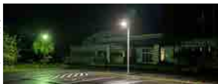
▶設置された 無電源街灯