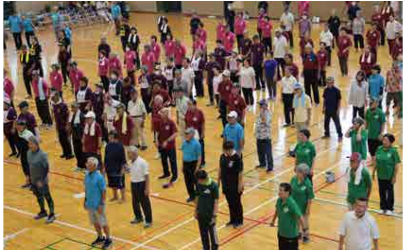
▼競技前に参加者みんなで準備体操