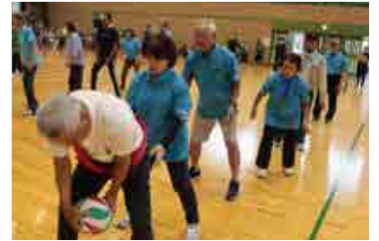
▲メディシンリレー競技