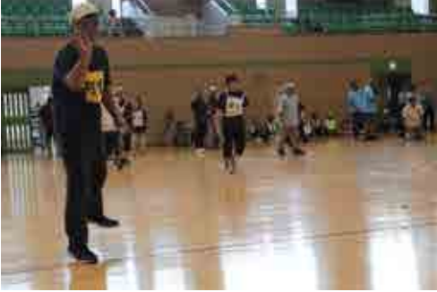
▼ハッピーカラー競技