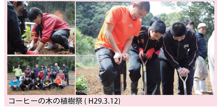
コーヒーマチの木の植樹祭 (H29.3.12)

トに関わってくれた子ども達や保護者の方をはじめ、周りから応援してくれる方々のおかげで感謝の気持ちでいっぱいです。プレッシャーも大きいですが、それ以上に楽しみながらこれからも宇検村で過ごしていきたいらなと思います。ご一読、ありがとうございます。