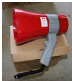
サイレン付きメガホン