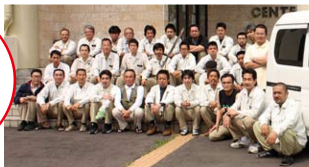
奄美マングースバスターズのみなさん