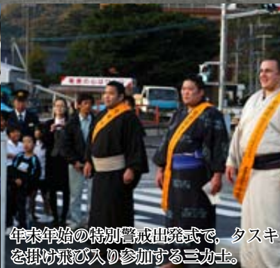
年末年始の特別警戒出発式で、タスキを掛け飛び入り参加する三力士。