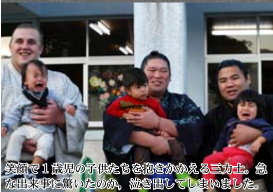
笑顔で1歳児の子供たちを抱きかかえる三力士。急な出来事に驚いたのか、泣き出してしまいました。

その後三力士は、同日に湯湾の信号交差点近くで行われた、年末年始の特別警戒出発式へ飛び入り参加し、交通安全と防犯への呼びかけを行いました。