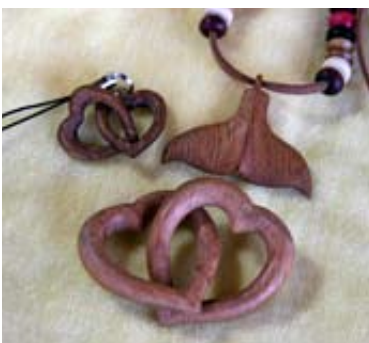
▶ 法月さんが制作した作品。木の素材と精細な作りにより独特な雰囲気を持っています。