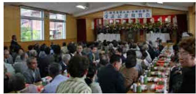
百五十人余りが出席し、宇検診療所の新たなスタートを祝った記念祝賀会