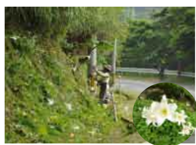
県道作業員の方もユリを傷つけないように草刈りをしていました。

真つ白に咲く野ユリ 村民が大切に守る 四月中旬頃、海岸沿いの県道に生えているたくさん野ユリが、真つ白な花を咲かせました。野ユリは、佐念集落から平田タエン浜の間に多く見られ、倒れそうなのは、村民の方が支柱を立てて管理するなど、大切に育てられています。今年、四月十五日に開花のピークを迎え、緑の季節となるこの時期、緑一色の山裾に真つ白な花が綺麗に生えました。来年もこの季節を楽しみにしたいと思います。