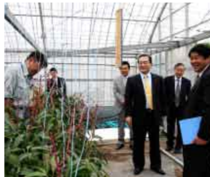
マンゴー農園を視察する伊藤知事