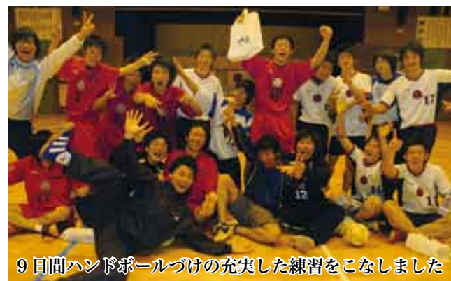
9日間ハンドボールづけの充実した練習をこなしました