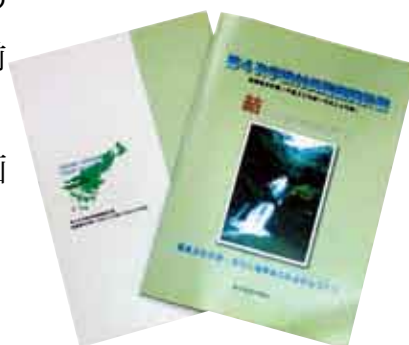
上は今回策定した後期基本計画

後期基本計画の策定にあたり、ご協力いただきました多くの皆様に心からお礼を申し上げます。詳細につきましては、次号からの広報誌へ掲載いたします。