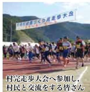
村完走歩大会へ参加し、村民と交流をする皆さん