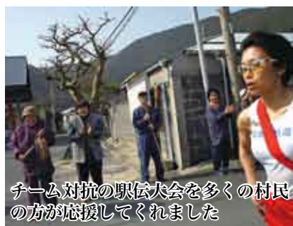
チーム対抗の駅伝大会を多くの村民の方が応援してくれました