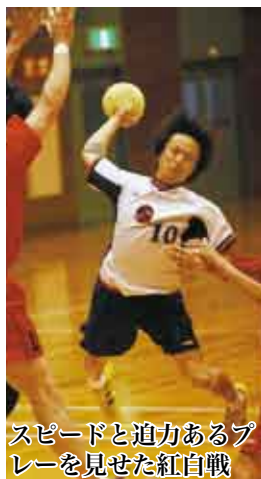
スピードと迫力あるプレーを見せた紅白戦