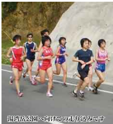
湯灣岳公園へ向けての走り込みです