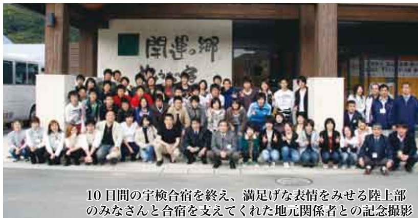
10日間の宇検合宿を終え、満足げな表情をみせる陸上部のみなさんと合宿を支えてくれた地元関係者との記念撮影