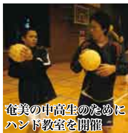
奄美の中高生のためにハンド教室を開催

また、三月一日にはハンドボール教室を開催し、奄美市の奄美高校と金久中学校のハンド部が丁寧な技術指導を受けました。