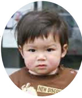
栄 (母) 奈伊瑠 凜斗 りんとう く H18・11・21生 芦検