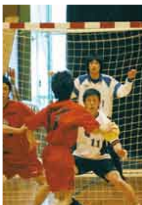
合宿の集大成として、最終日に紅白戦を実施