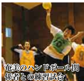
奄美のハンドボール関係者との練習試合