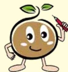
イメージキャラクターの『つつー』