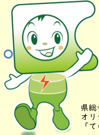
県総合教育センター オリジナルキャラクター 「ていらん」