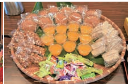
▲食生活改善グループによるお茶菓子