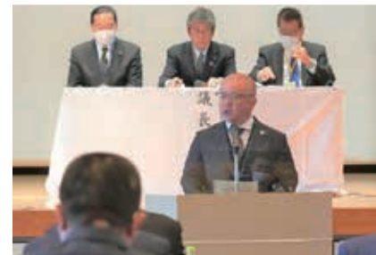
▲保池議員による提案理由の説明