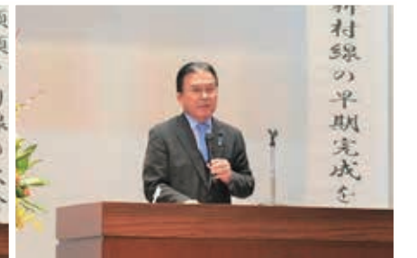
▲県議会議員3名による県政報告