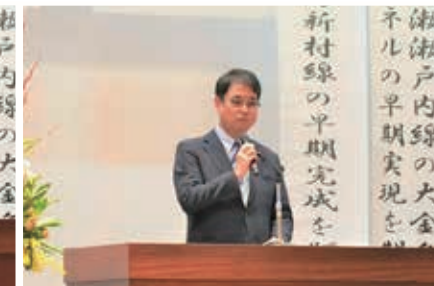
▲国会議員2名による国政報告