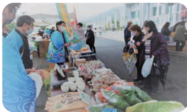
▲七ヶ宿・出店ブースの様子 ～世界自然遺産登録1周年記念イベント～

も継続的に販売をできるように協議を進め年間を通し相互の物流が充実し販路拡大につながるよう取り組んでいきます。②はコロナの影響もあり途絶えていたが2グループのゼミ生の受け入れがあった。今後も大学からの要望があれば運動部やゼミ生の受け入れを積極的に受け入れたい。③は慰霊碑建立地の責務として受け入りだけではなく相互に交流できるような仕組みづくりを検討していきます。