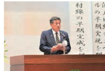
▲元山村長歓迎の挨拶