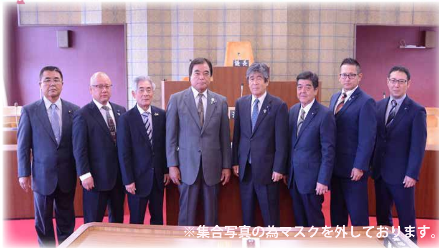
※集合写真の為マスクを外しております。

本年も村議会に対し変わらぬご支援・ご協力を賜りますようお願い申し上げますとともに、皆様のご健勝、ご多幸を心からお祈り申し上げます。