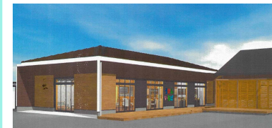
▲体験観光多目的交流施設完成イメージ図▲

さと探検隊を実施し、地域の現状や課題を見て回り、点検マップを作成。このマップを参考に新規事業を立ち上げて整備できればと考える。