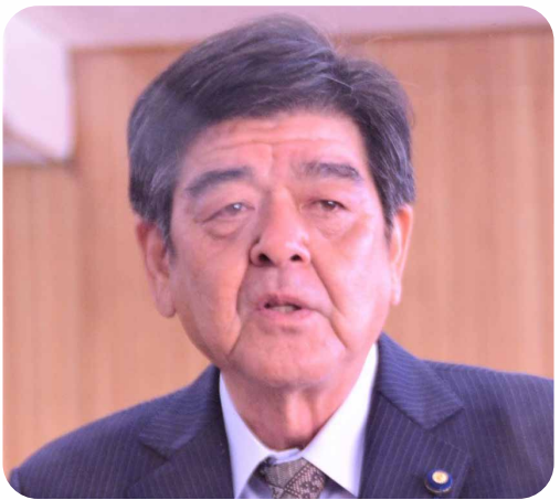
新型コロナウイルス予防ワクチン 3回目接種について 肥後充浩議員