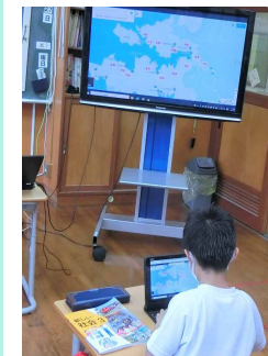
▲タブレットでの授業の様子▲

(村長) 利用状況については、すべての学校で積極的に利用されている。今後も教育の情報化に向けた取り組みを推進し、ICT情報通信技術を適切、安全に使いこなし、情報活用能力を育成していけるよう支援したい。