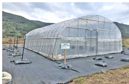
▲育苗ハウスの様子▲

(肥後) 基金が幾ら積み上がったも、子供達の為に使えないような基金であつたら、基金として役立つかない。ますます子供が少なくなっていく。どこで、何時、使えるのか、回せる基金があればそれは回した方が良く。そういった考えも考慮を行政にお願いしたい。(要望)