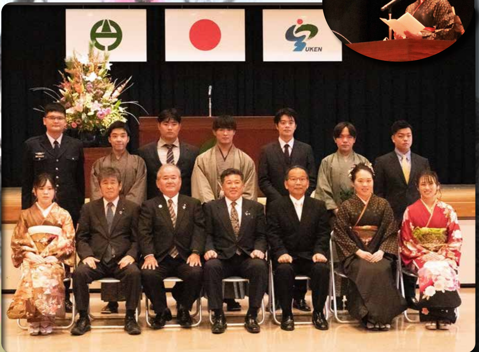
▲宇検村成人式 (R4.1.4) ▲