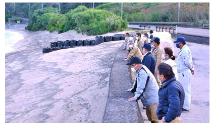
▲ 屋鈍海岸の様子 ▲