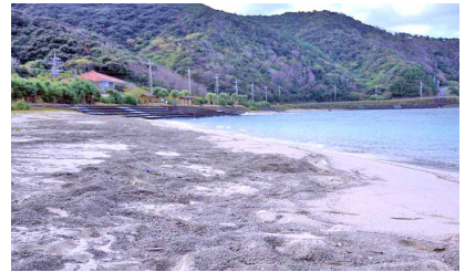
▲ タエン浜の様子 ▲