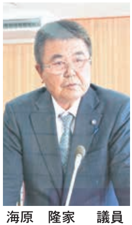
海原 隆家 議員