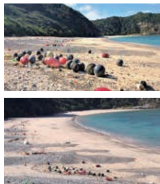
▲船越海岸漂着ゴミ

う、実施延長の要望を今後も行ってまいります。 二点目に鳥獣被害防止対策交付金事業（イノシシ侵入防止柵購入補助）の要綱見直しとの質問ですが、県に確認したところ鳥獣被害防止総合対策交付金事業の支援対象となるイノシシのワイヤーメッシュ柵については、被害防止対策としての費用対効果を発揮させて事業効果を高めるため、令和3年度から綿材の直径について5mm未満の場合であっても強度等が同等以上であると認められる場合には支援対象となり得ることから、具体的な提案内容があれば相談していただきたいとの回答でありました。