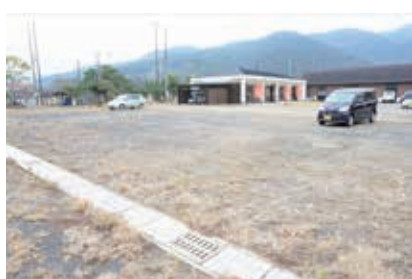
▲駐車場整備予定地

発信していきたい。また、その他の施設についても訪ねてきた方に分かりやすいような工夫をし、発信していきたい。