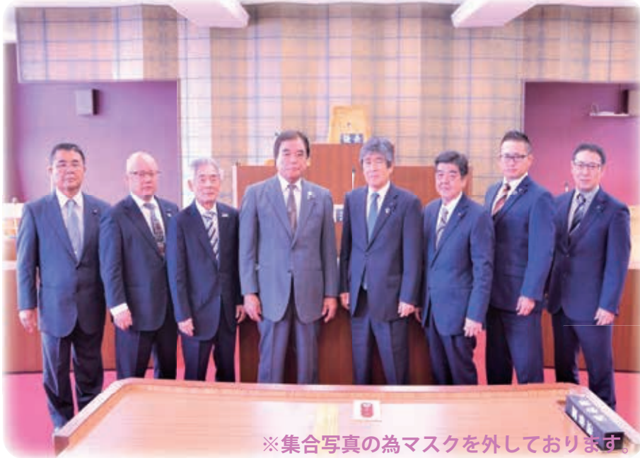
※集合写真の為マスクを外しております。

本年も村議会に対し変わらぬご支援・ご協力を賜りますようお願い申し上げますとともに、皆様のご健勝、ご多幸を心からお祈り申し上げます。