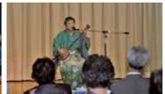
阿室保育所の踊りや島唄などで盛大に祝った金婚式