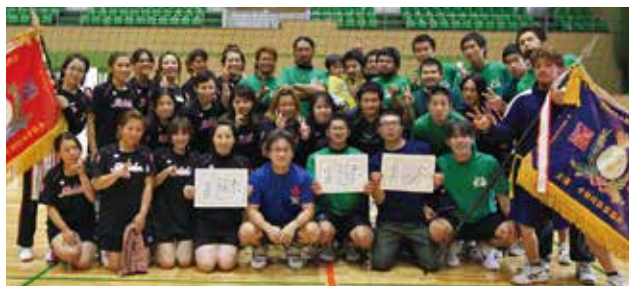
賑わいを見せたバレー大会、下の写真は優勝した芦検