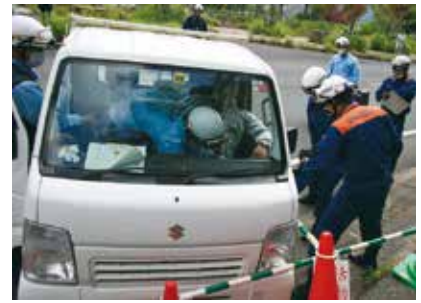
救出救護訓練のようす 現場は芦検トンネル付近。倒木も想定しチェーンソーなどの道具も使われ本格的な救出活動を行いました。