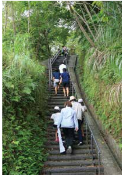
避難場所に向かう村民（湯湾） 村内では津波・高潮時緊急避難場所に22カ所が指定されています。