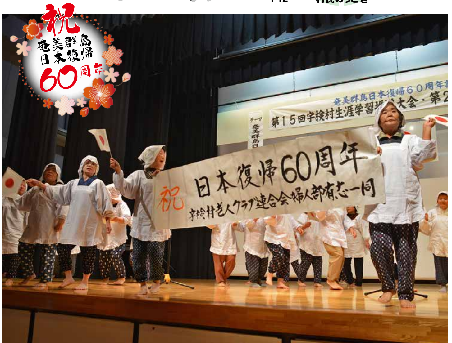
生涯学習推進大会・文化祭での一コマ（11月24日／宇検村元気の出る館）