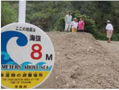
高台に避難してきた村民（須古） 多くの方に参加いただき、村民の防災意識の高さを感じました。