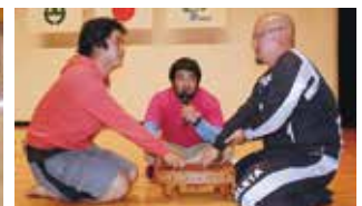
勉強会と交流会で親睦を深める参加者