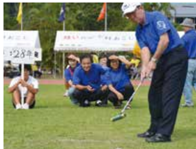
お揃いの青シャツを着て大会に参加する「昭和28年生」の皆さん。

第58回宇検村民体育大会が10月13日（日）に村陸上競技場において、盛大に行われました。昨年は台風の影響で中止となったため今回は2年ぶりの開催となり、出場選手から応援する方々まで、久しぶりの体育大会を楽しんでいる様子でした。大会当日は好天にも恵まれ、村内14集落10チームが46の種目で熱戦を繰り広げました。また、今年還暦を迎えられる「昭和28年生