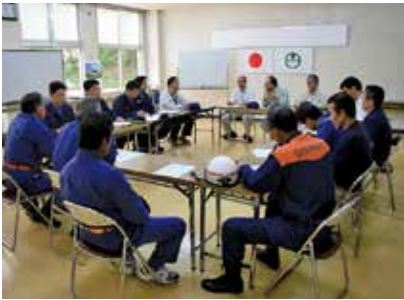
訓練終了後に行われた検討会 検討会では、今後の訓練の方法や避難施設の整備などについて多くの意見が出されました。