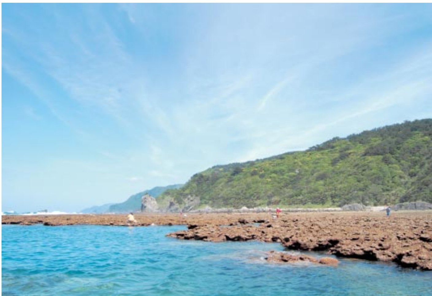
真っ青な空の下、リーフにて浜下りを楽しむ姿（船越海岸）