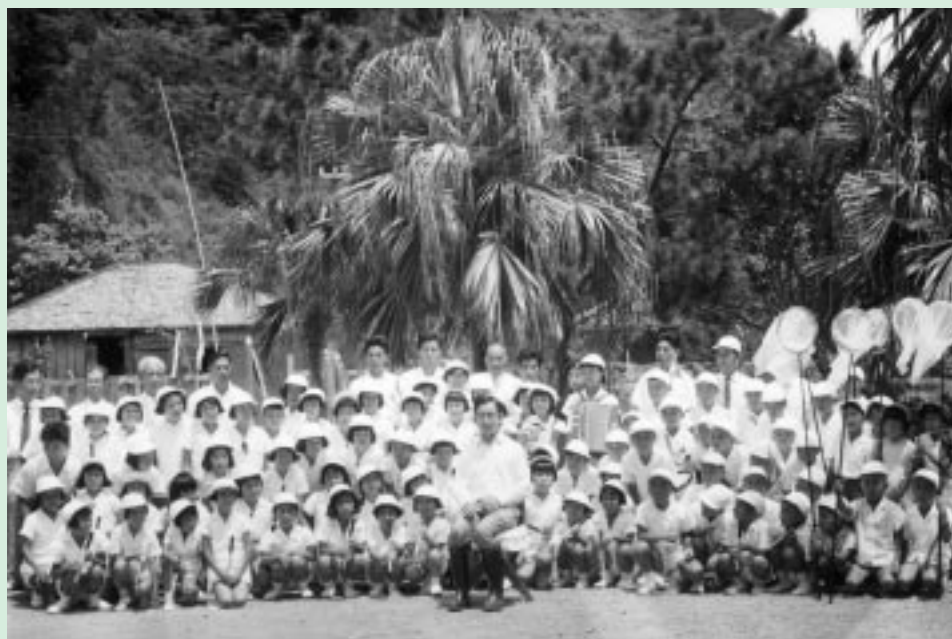
田検小学校校庭で義宮様を囲んで記念撮影。

写真はその時代の風景を正確に写し、その画像は人々の忘れかけたウムイを鮮明によりみがえらせる。