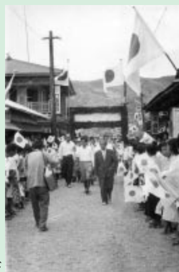
村民の歓迎を受けながら湯湾商店街をパレード

皆さんのアルバムの中にある懐かしい写真をご提供下さい。このコーナーで紹介いたします。（尚、提供いただいた元の写真はお返します。）