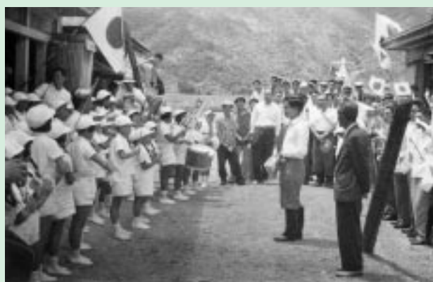
湯湾棧橋で歓迎の鼓笛演奏

写真の子ども達は、昭和24年～26年生まれの方々です。見覚えのある顔はいませんか。