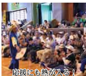
応援にも熱が入る!

第39回北大島地区高齢者スポーツ大会 高齢者の健康増進や交流を目的に毎年開催されている、「北大島地区高齢者スポーツ大会(県老人クラブ連合会・大島地区老人クラブ協議会主催)」が十月二十六日に、宇検村総合体育館で開催されました。大会には奄美大島、喜界島から約五百四十人が参加し、グラウンドゴルフや輪投げ、水入れなど八種目が行われ、真剣勝負の中にも楽しみながら競技に取り組む姿が見られました。宇検村からは、先に行われた村の高齢者スポーツ大会の結果に基づき選ばれた集落を二チームに編成し、大会へ出場。見事にBチームが優勝、Aチームが準優勝する快挙を達成しました。