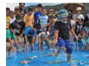
▲ 今年初めて開催されたちびっ子宝探しで、お目当ての豪華景品を狙って一生懸命にお菓子やコインを集める子供たち