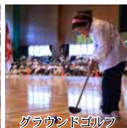
グラウンドゴルフ