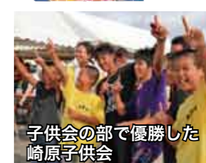
子供会の部で優勝した崎原子供会