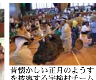
昔懐かしい正月のようすを披露する宇検村チーム