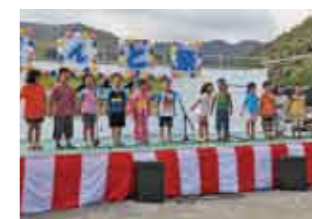
▲ 夕方に特設ステージで村の連合青年団が主催した舞台イベントで、歌を披露する田検小学校一年生の児童の皆さん