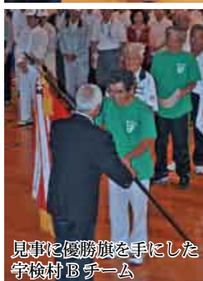
見事に優勝旗を手にした宇検村 B チーム

第39回北大島地区高齢者スポーツ大会 高齢者の健康増進や交流を目的に毎年開催されている、「北大島地区高齢者スポーツ大会(県老人クラブ連合会・大島地区老人クラブ協議会主催)」が十月二十六日に、宇検村総合体育館で開催されました。大会には奄美大島、喜界島から約五百四十人が参加し、グラウンドゴルフや輪投げ、水入れなど八種目が行われ、真剣勝負の中にも楽しみながら競技に取り組む姿が見られました。宇検村からは、先に行われた村の高齢者スポーツ大会の結果に基づき選ばれた集落を二チームに編成し、大会へ出場。見事にBチームが優勝、Aチームが準優勝する快挙を達成しました。