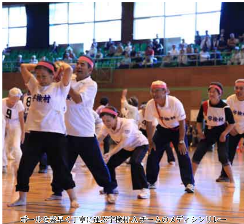
ボールを素早く丁寧に運ぶ宇検村 A チームのメディシンリレー