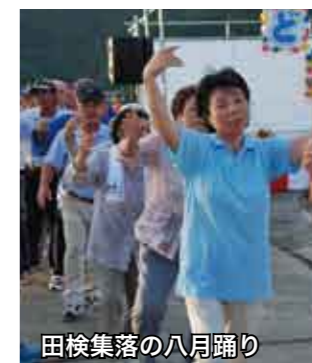
田検集落の八月踊り