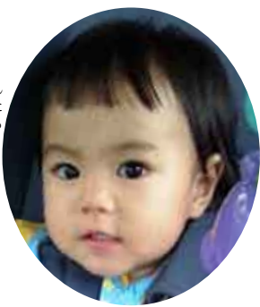
中田凛太郎 りんたろう (保護者) 翔平 生 芦 検