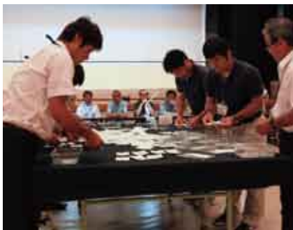
開票作業のようす(8月26日元気の出る館)

任期満了に伴う宇検村議会議員選挙が八月二十一日告示され、同二十六日に投票が行われました。 今回の選挙は定数八に対し現職七人と新三人の計十人が立候補し、告示と同時に立候補者は、一斉に街宣活動を始め、支持者獲得のため、村内をくまなく巡回し精力的な運動を繰り広げました。 開票作業は午後八時から元気の出る館で行われ、票の仕分け作業も順調に進み、午後九時には最終確定が出され、新議員の顔ぶれが決定しました。