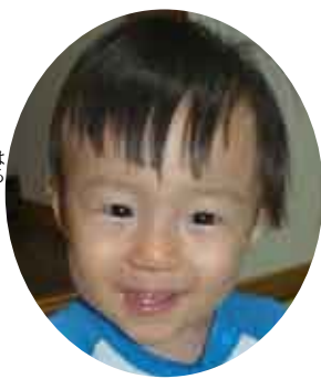
川畑 (保護者) 亮 生 芦 検