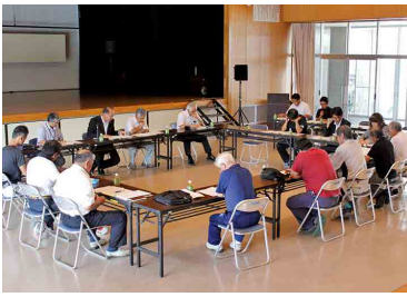
↑ 国文祭村実行委員会のようす