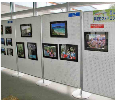
↑ 昨年度開催されたフォトコンテストのグランプリ作品(上)と展示会(下)のようす