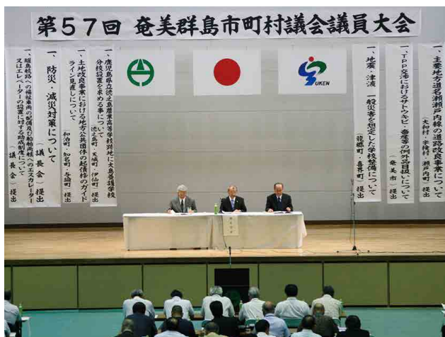
奄美群島市町村議会議員大会