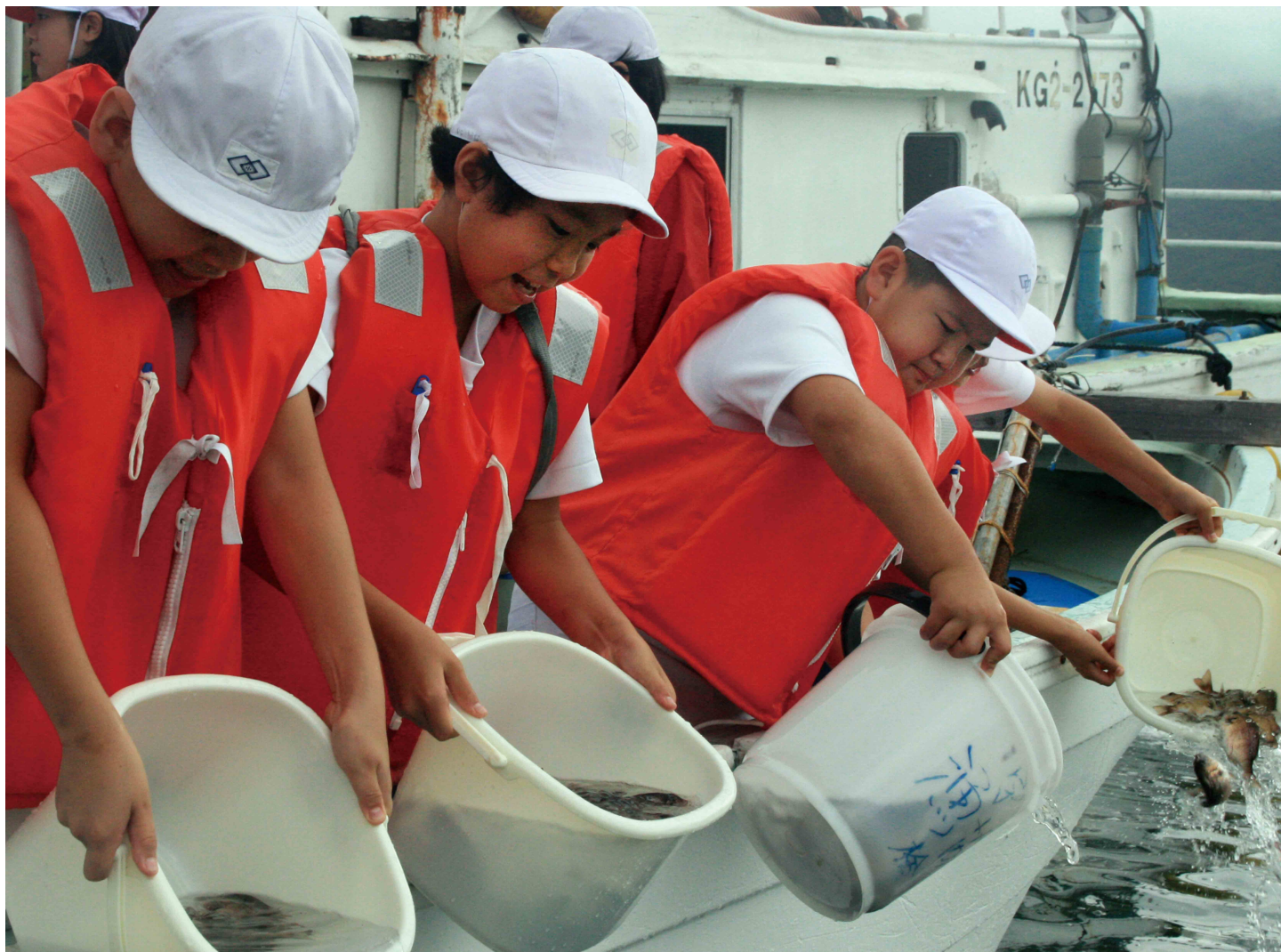
田検小4、6年生による鯛の稚魚放流（課外授業）