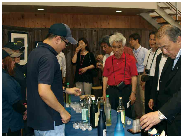
奄美大島開運酒造で焼酎を試飲☆

5月29日(木)に珍しい状態のハブが役場に持ち込まれました。なんとそれはハブがケナガネズミを捕食中に捕獲したもので、ハブが口を大きく開け、天然記念物のケナガネズミを丸呑みしようとしている状態でした。捕獲場所は、宇検村役場入口から湯湾岳に登る途中にある浄水場付近で、発見者は「ハブが動かないので最初は死んでいるのかと思った。」と驚いた様子で発見した時の話をしていました。