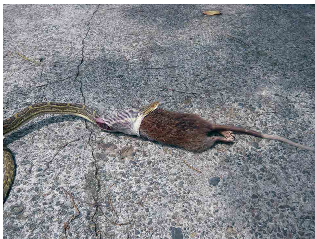
役場に持ち込まれた 捕食しているハブ

5月22日(木)宇検村総合体育館にて第57回奄美群島市町村議会議員大会が開催されました。奄美群島12市町村議会議員、市町村長、奄美選出の県議会議員など総勢200人余りが出席し、県・国へ陳情する議題7件が採択されました。研修会では「新奄振法(奄美群島振興交付金)について」他の市町村担当職員なども加わり、これからの奄美群島活性化のために活力ある会が行われました。