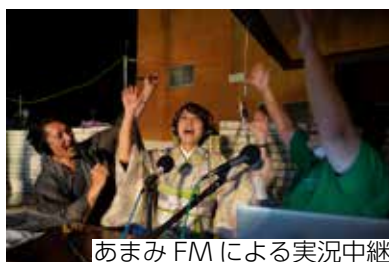
あまみFMによる実況中継