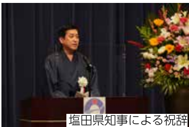
塩田県知事による祝辞