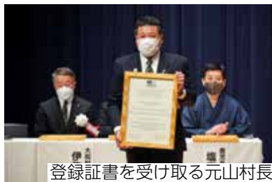
登録証書を受け取る元山村長