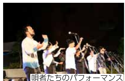
唄者たちのパフォーマンス