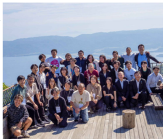
研修最終日@ドンデン高原ロッジ

日本離島センター主催の島づくり人材養成大学in佐渡島5日間に参加してきました。全国の離島から23人の受講者が集まり、講師や離島センターの方、現地のコーディネーター引率のもと、観光やフィールドワークを通じて気づいたことや感じたことを共有しました。佐渡島を知ることにより、奄美大島や宇検村の特徴を再発見するいい機会となりました。また全国の離島で活躍しているメンバーとつながりができたことで、離島で共通する課題への取り組み等の情報共有ができる仲間ができたことは、これからも生きていくつながりになったと思います。これからも離島や地域おこしと繋がることのできるイベントがある際には積極的に参加していきたいと思っています。(辻)