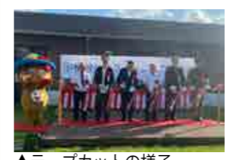
▲テープカットの様子

10月1日より新たに運行を開始する公共ライドシェア「やけうちライド」の出発式がケンムンの館前で行われました。式には関係者など約20人が出席し、運行に使用する車両披露やテープカットが行われました。 村内では、10月1日から屋鈍・湯湾線の路線バスが休止するため、村民の移動手段として期待されます。 運行内容は、村内を5つのエリアにわけ、エリア内やエリア間の移動に加え、村外のバス停(新村や今里)まで移動できます。また週2回、奄美市の名瀬市街地や病院への往復便も運行します。利用は、予約制のため、電話またはアプリから予約をお願いします。