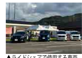
▲ライドシェアで使用する車両