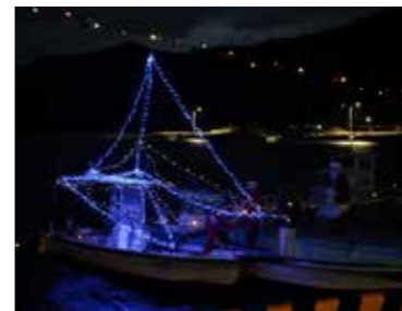
▲海から船でやってくるサンタクロース

この企画は、今年で4回目になり、他にも集落の護岸にイルミネーションを設置し、クリスマスらしい雰囲気を出しました。