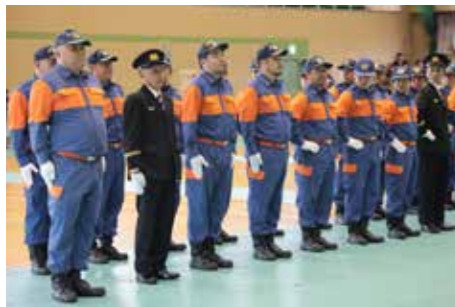
▲消防団通常点検 ▼一斉放水

式典では、日本消防協会会長表彰30年勤続章のほか鹿児島県消防協会総裁表彰精績章など、延べ14名が表彰されました。出初式の締めくくりには、恒例の一斉放水が行われ、観客を楽しませました。