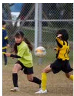
▲各カテゴリーで懸命にプレーするマテリアの選手たち