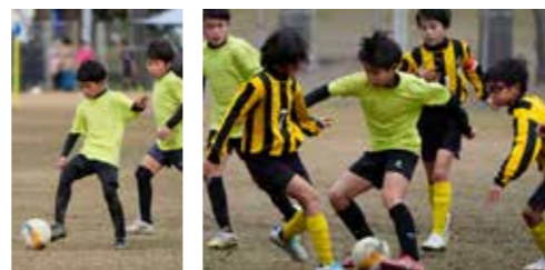
【各カテゴリーで懸命にプレーするマテリアの選手たち】