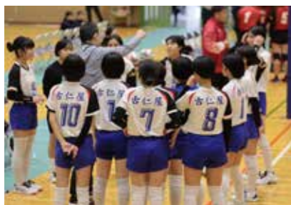
▲タイムアウトで支持を受ける選手たち

村総合体育館において村バレー協会主催の第20回宇検村ケムン杯中学校女子バレーボール大会が開催され、大島本島内から6チームが出場を予定していましたが、宇検村の田検中学校女子バレーボール部を含む合同チームが体調不良者が続出し、棄権となり、5チームの参加で熱戦が繰り広げられました。決勝戦は、1セット先行されるも、その後2セットを連取し、逆転した古仁屋中学校が見事に2連覇を達成しました。