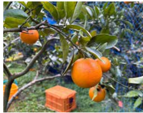
黄金色に輝くタンカンの様子