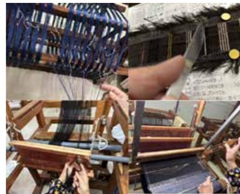
大島紬の全行程を体験。どれも細かくて大変。考えた人も、携わってきた人もすごい！