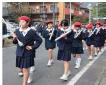
▲パレードを先導する田検小の鼓笛隊