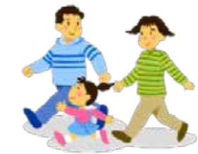
【空き家を探している人】