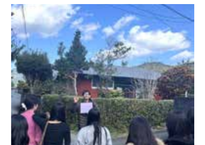
私が案内人となりシマ歩きをしました