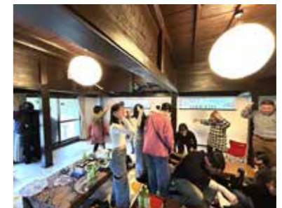
集落の方と六調を楽しむ高校生たち