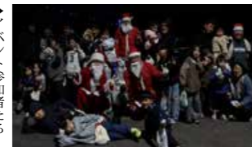
▶イベント参加者たち