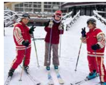
▲▼雪を楽しむ生徒たち

今年は、暖冬で12月になっても暑く雪が少ない状況でしたが、雪遊び・スキー体験の前日から雪が降り続け、体験の当日には、しっかり雪が積もり無事に七ヶ宿町のスキー場でスキーを体験することができました。七ヶ宿町の生徒たちも雪が少なく心配していたようで「七ヶ宿町のスキー場でスキーなどを体験してもらえて、嬉しかった」と話していました。