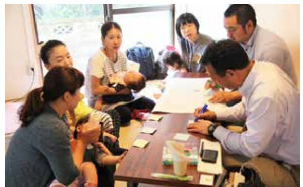
▲セレ部女子会の様子(平成28年5月11日 みんなのいえ(宇検))