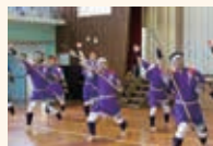
須古鎌踊り保存会