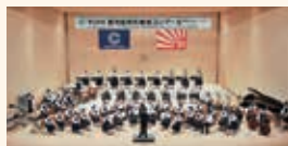
大島高校吹奏楽部