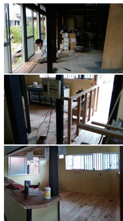
急ピッチで改装中!!

そろそろ開店できそうだなという時はラジオや新聞等を通して、みなさまに詳細をお知らせいたしますので、楽しみにお待ちくださいましたら幸いです。 また、無事にプレオープンができましたら14HIKARI DAYS Project(トヨヒカリプロジェクト)も再スタートしていきたいと思えます! (*1)14hikari(とよひかり)は、宇検村の集落の数(14)と、そこに住む人々の温かさ(光)を表した造語です。