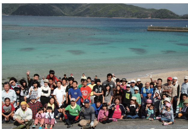
▲全員で海岸清掃をした際の様子