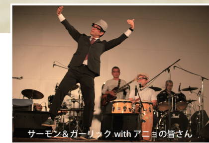
サーモン&ガーリック with アニヨの皆さん