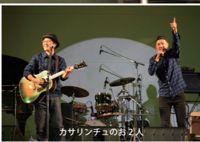
カサリンチュのお2人