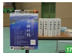
15 七ヶ宿町からの特産品を販売 16 宇検村生活研究グループの皆さんも手作りお菓子を販売 17 記念式典に合わせて発行された「宇検村誌」

表して鎮寺裕人大島支庁長、金子万寿夫衆議院議員、禧久伸一郎県議会議長、伊集院幼大島郡町村会長から祝辞をいただきました。また、宮城県七ヶ宿町小関町長と宇検村元田村長は、七ヶ宿町60周年記念式典会場で友好姉妹都市調印を行ったことを村民に報告し、固く握手を交わしました。その他、式典に花を添えてくれたのが宇検村に縁のある