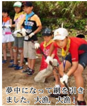
夢中になって網を引き ました。大漁、大漁！