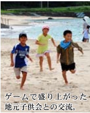
ゲームで盛り上がった 地元子供会との交流。