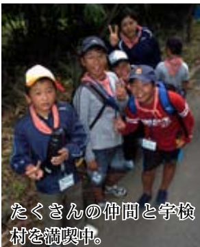
たくさんの仲間と宇検 村を満喫中。