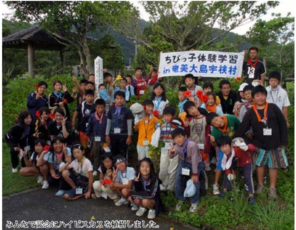
みんなで記念にハイビスカスを植樹しました。