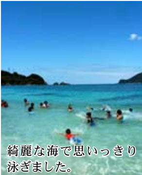
綺麗な海で思いっきり 泳ぎました。