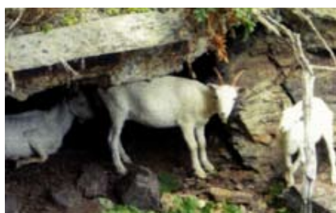
山羊による被害の状況