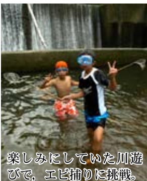
楽しみにしていた川遊 びで、エビ捕りに挑戦。